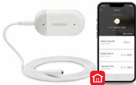
Detector de inundație și îngheț Braukmann L1 WiFi

Împreună, aceste produse le oferă clienților mai multă siguranță, alertându-i în cazul scurgerilor sau conductelor înghețate. În plus, vana de închidere reduce potențialele daune survenite în locuință. Aceasta poate fi gestionată de pe un smartphone, prin intermediul aplicației Resideo, fiind astfel o soluție de neratat pentru proprietarii de locuințe pasionați de tehnică din zilele noastre.