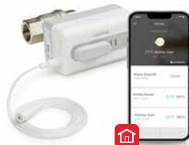
Vană de închidere anti-inundație L5 WiFi